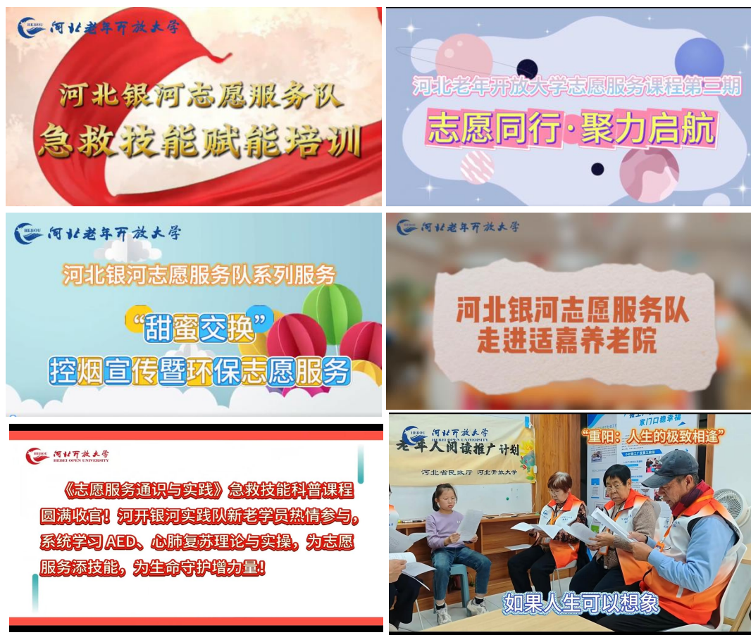
志愿服务活动电子宣传片