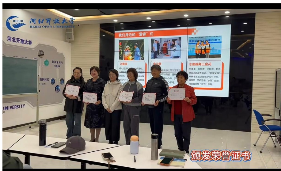
学习、服务双积分机制

平台的电子积分商城，线下与医疗健康、文化服务、老年大学等企业实现志愿服务合作，共建“积分联盟”，实现积分通兑。特别设计可视化纸质积分册强化仪式感，形成线上线下积分管理的情感联结。