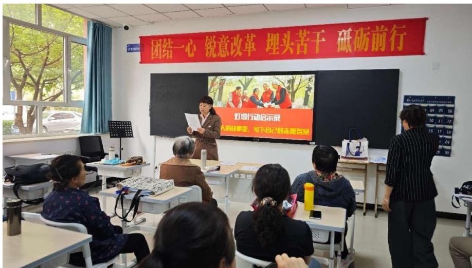
“银龄志愿者故事汇”

册、宣传片、工作坊复盘等多种方式，激发老年人的荣誉感和成就感，构建“事迹传播—荣誉赋能—经验传承”的闭环激励机制。