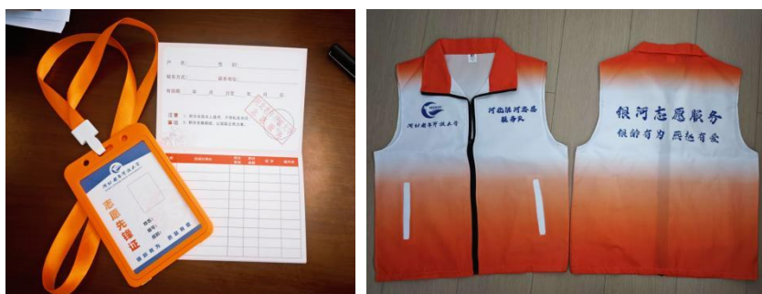
志愿服务队“三统一”身份标识

线上志愿服务队入驻石家庄市委社工部“石志兴石”志愿管理平台，完成志愿者身份注册，线下建立“三统一”的身份认证体系：统一编号，授予专属志愿者编号（如“2025001”）；统一标识，发放橙色志愿工服（印有学校标识、志愿服务队名称与“银龄有为，燕赵有爱”标语）；统一管理，制作志愿服务证、时长记录簿，开发“银龄服务档案”电子系统，集成健康信息、培训记录、服务时长等数据，形成可视化成长轨迹。