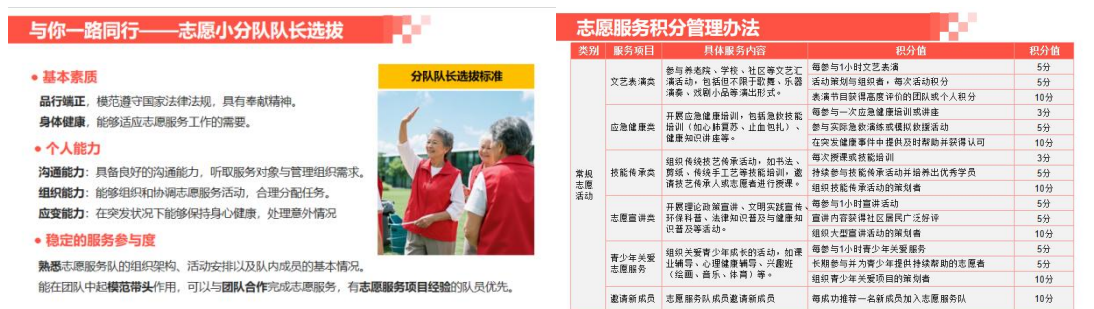
银河志愿服务队管理制度图片

激励措施等细则。组建由队长、教师、班主任构成的服务管理团队，承担战略规划、资源协调、质量监控工作，实现服务需求精准抓取与服务资源高效配置。