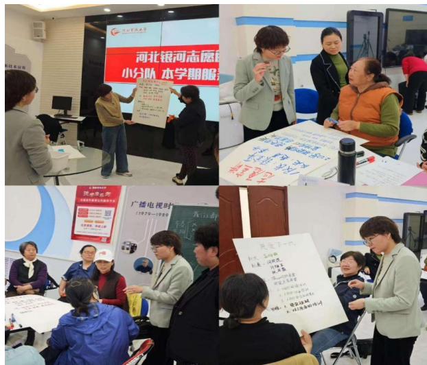
专业化分队季度服务规划课程现场

志愿服务队按特长组建文艺表演、志愿宣讲、应急健康、关爱下一代、记忆技艺传承 5 支专业分队，实行“队长推选-自主运营-学校支持”管理模式。各分队根据服务领域制定季度服务规划，定期向学校报送培训需求清单，由学校提供师资、场地等培训资源以及经费支持，通过自主管理激发老年人的自主参与意识。