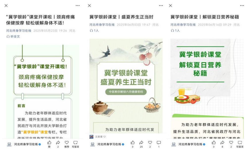
“冀学银龄”法律、康养、保健主题微课

每次服务需提前 3 天在“石志兴石”平台发布，审核通过生成电子保险凭证；活动前 30 分钟开展安全培训，重点强化健康监测、紧急避险等技能。每月线上依托“河北终身学习在线”公众号平台，开展“冀学银龄”法律、康养、保健主题微课推送，确保银龄志愿者主动健康意识提升。线下举办“银龄安全讲堂”，围绕慢性病管理、法律维权、心理调适等主题开展专题培训，确保志愿者自护能力达标率 100%。