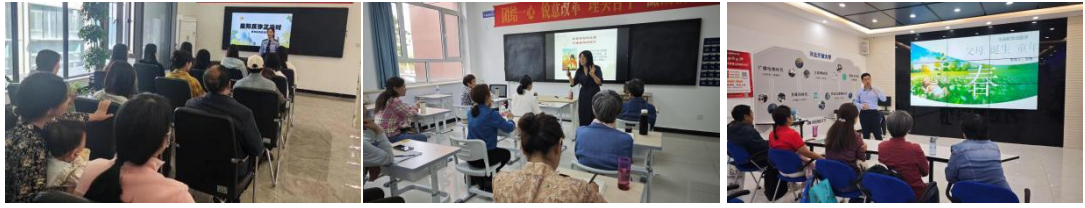
慢性病管理、法律维权、心理调适专题培训