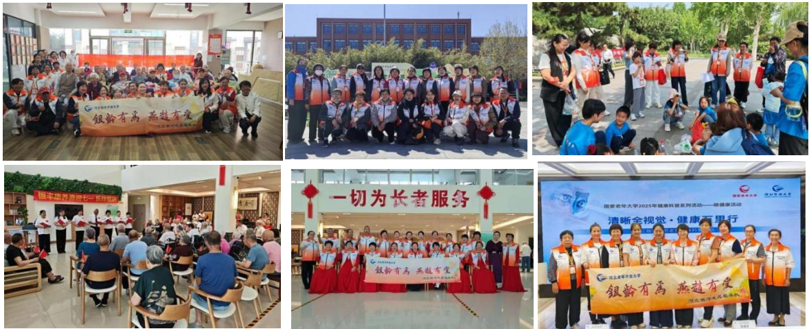
银河志愿服务队“橙光主题”服务活动