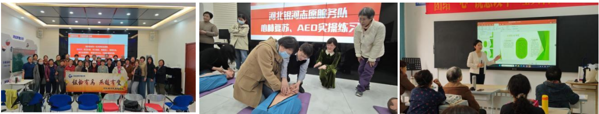
《老年志愿服务通识课程》志愿者基础通识、急救、法律培训课堂

健全社会参与能力标准，开发老年志愿服务通识课程体系，构建“理念唤醒+技能提升+实践转化”三维培养框架，共计8课时，课程结业颁发能力认证证书。理念层开设“老年社会价值实现”专题思政课，引导学员提升社会价值认同；技能层设置急救技能、法律常识、沟通技巧等模块化课程，提升学员志愿服务专业素养；实践层创设“社区需求调研-服务方案设计-现场执行-复盘优化”全流程实训项目。采用“线上自学-线下精讲-实践巩固”的方式，利用“河北终身学习在线”平台进行线上线下混合式教学，特别聘请红十字会培训师、资深社工面授指导。已完成300人次课程培训，98%通过考核获得能力认证证书，人均掌握2项以上专项服务技能。