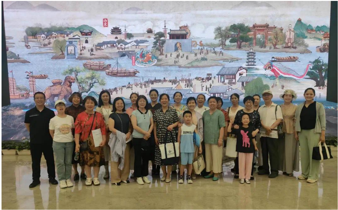
图2 “诗话千年运河” 中国大运河非遗馆研学活动