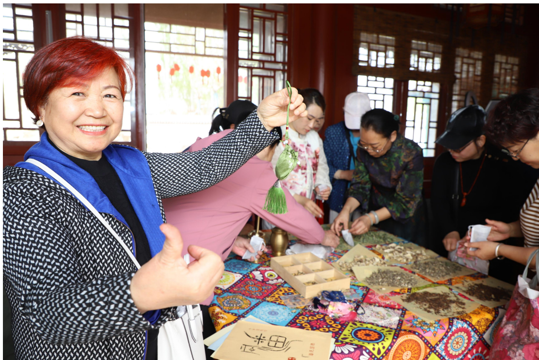
图4 “大运河文化寻脉之旅” 沧州园博园研学活动