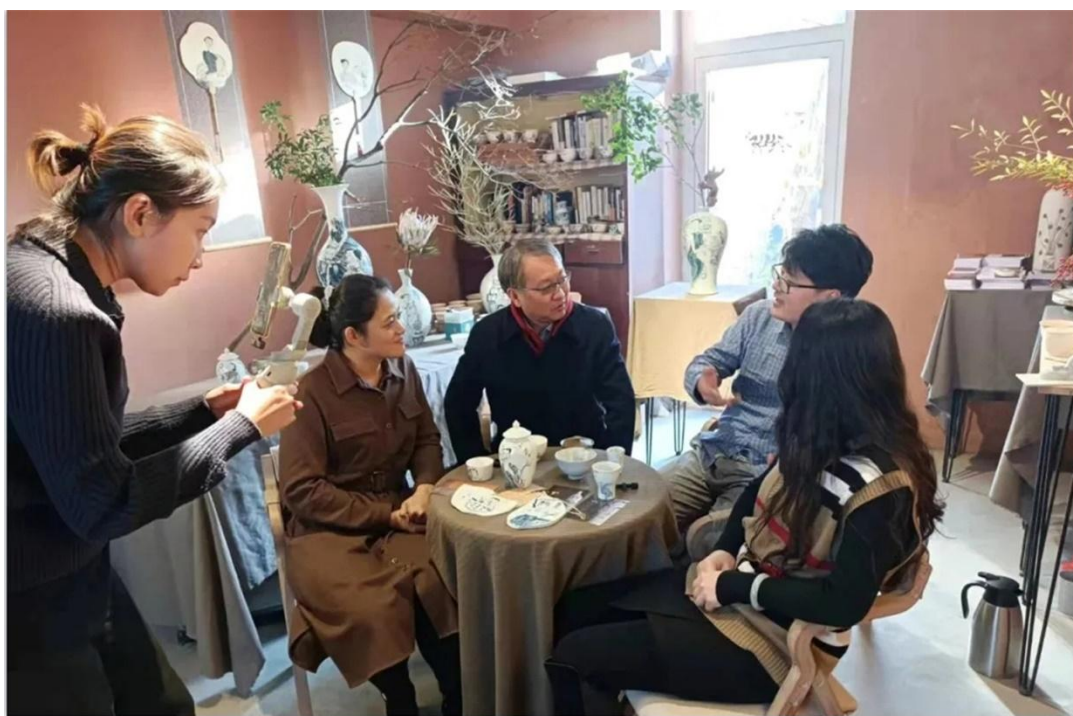
图 6 “直播带学”系列活动

学校探索资源整合、骨干培育、教育植入社区实现辐射裂变的“1+1+N”社区(老年)教育模式，先后建立 14 个省级社区教育实验基地、承担 2 个省级社区教育实验项目，充分激活各高校、社区、企业及其它社会组织的积极性；与各基地联合开展“直播带学”系列活动，把课堂搬到纪念馆、革命旧址等更多现实场景中，引导学员在实践中培育家国情怀。