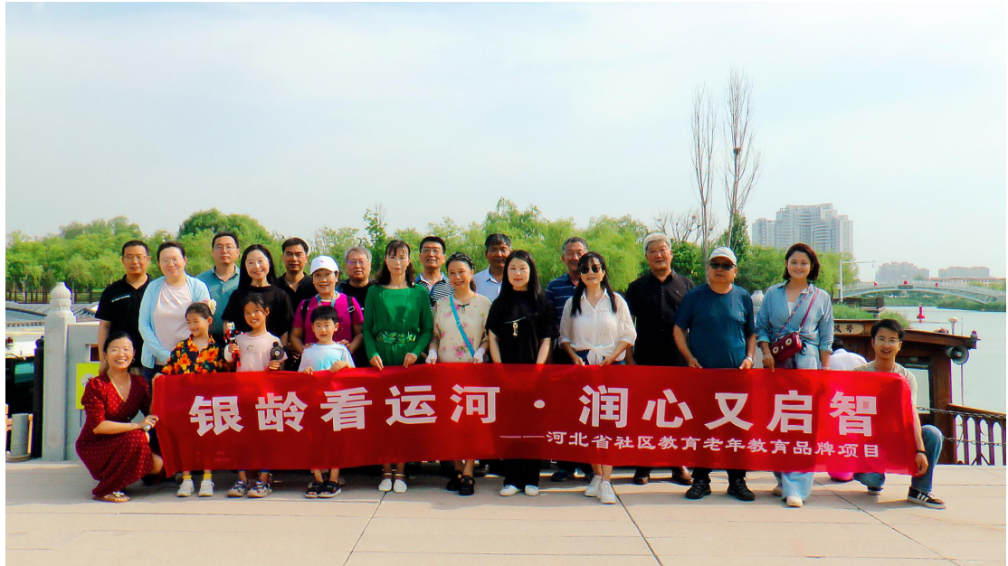
图3 “银发摇橹声·代际共话运河记忆”泛舟大运河研学活动