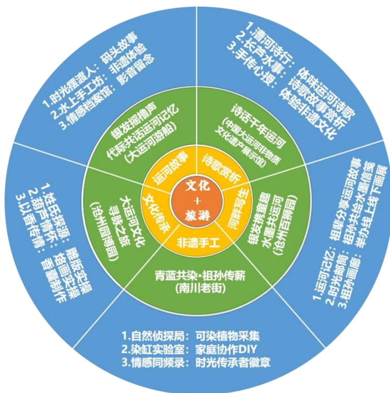
图 1 “文化+旅游”代际共学路线

以“文化+旅游”为主线，设计 5 条以运河文化、红色文化、非遗文化为主题的代际共学路线，建立“学习-实践-传承”的完整闭环，深度融合地方特色与文化价值，促进知识流动，编织情感纽带，实现可持续发展和经济效益的双赢。