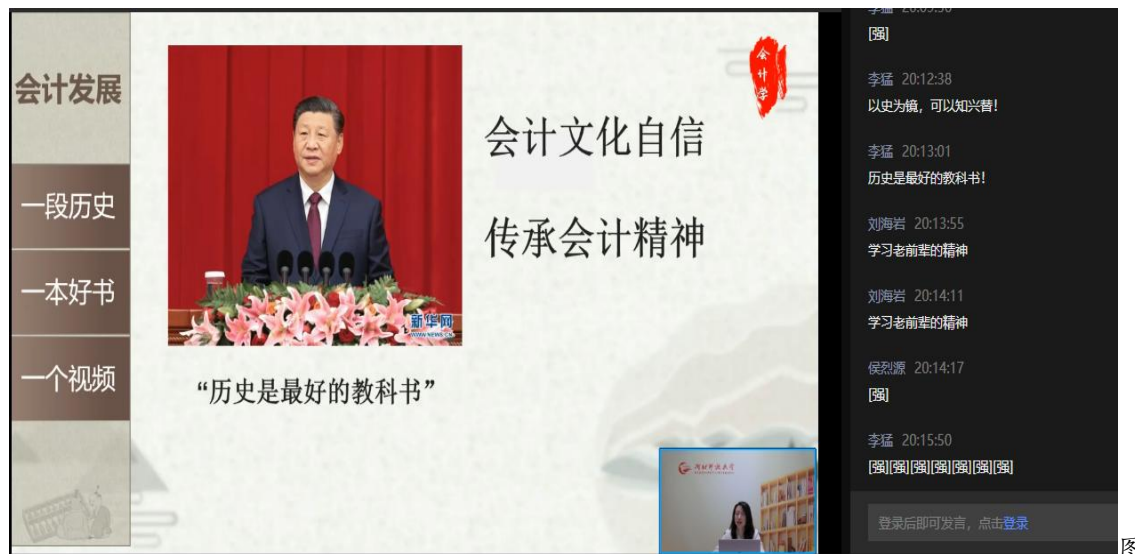
图 3 直播课思政环节截图

团队负责人对每次直播课，都会与主讲教师进行课前的思政与教学相融合的反复讨论与打磨，将社会主义核心价值观融入到直播课程中，有既有“专业思政”，也有“时事与热点思政”。