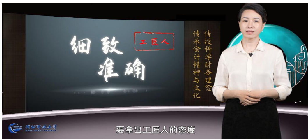
图 2 微课思政节选截图

每一份微课在团队精心选择、反复打磨下，都以培养学生的“国家认同、爱国自信、诚信守法、立德力行、爱岗敬业、勇于担当”的精神品质为前提，深挖思政内容。