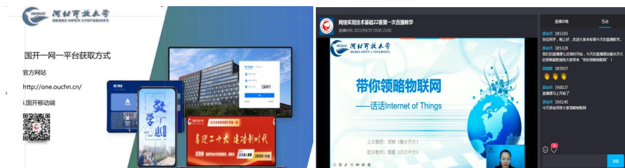
部分融入课程思政与网络安全相关直播内容截图